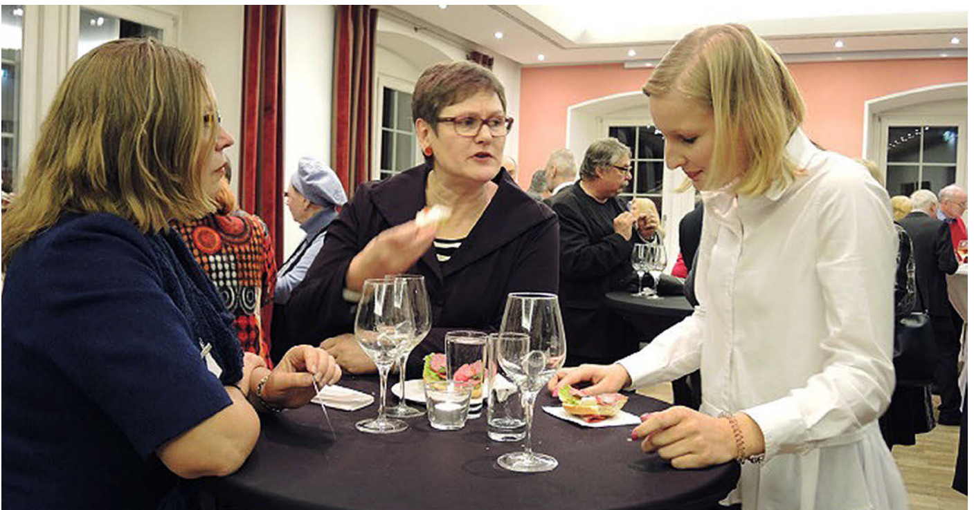
► Leni Breymaier (Mitte) und Gäste

Leni Breymaier ging auch auf die Debatte um eine Reform des baden-württembergischen Landtagswahlrechts ein. Angesichts des mit 24,5 Prozent schlechtesten Frauenanteils aller Landtage sei der „Handlungsbedarf offensichtlich“, so die Politikerin. Zum Abschluss fokussierte sie ihren Vortrag auf die Sondierungs- und die anstehenden Koalitionsgespräche. Breymaier zählte aus ihrer Sicht wichtige Erfolge im Sondierungspapier auf, wie die Wiedereinführung der paritätischen Finanzierung der Sozialkassen, die Abschaffung von Schulgeld unter anderem in Pflegeberufen, die Festlegung der Rente auf 48 Prozent. Sie lobte das Europa-Kapitel und war zufrieden mit dem Stimmverhalten der baden-württembergischen Delegation: 75 Prozent haben für die Große Koalition gestimmt – das sei ein repräsentatives Ergebnis, was auch ausdrücke, dass nicht alle damit einverstanden sind und es an der Basis deshalb auch noch viel Diskussionsbedarf gebe, dem sich die Landes-SPD unbedingt schonungslos stellen wolle.