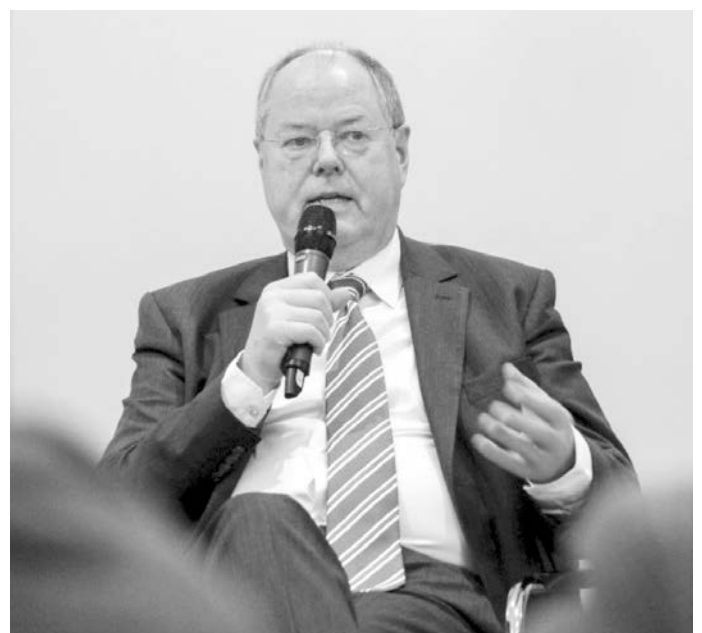
► Peer Steinbrück

Zunehmend wird erkennbar, dass die EU kein außenpolitisches Projekt habe und auch die Disparitäten in und zwischen den Mitgliedsländern stiegen. „Eine Antwort hierauf ist nur in einer Weiterentwicklung und Revitalisierung der EU zu finden“, so Steinbrück. Eine notwendige Maßnahme sei die Reform der Wirtschafts- und Währungsunion mit einem eigenen Bud-